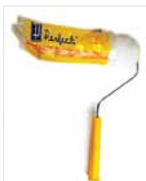
RODILLO LISO PERFECT 9" 109