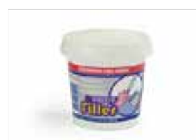
RESANADOR PARA MUROS