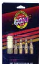
JGO CONEXIÓN RÁPIDA