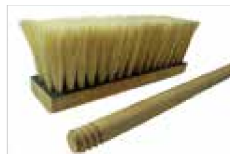
CEPILLO P/IMPERMEABILIZAR ECONÓMICO