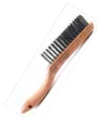
CEPILLO PERFECT ALAMBRE #0054 C/MANGO