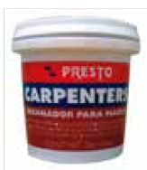
RESANADOR PARA MADERA