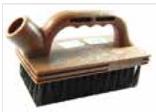
CEPILLO PERFECT #3201 ESTUCO