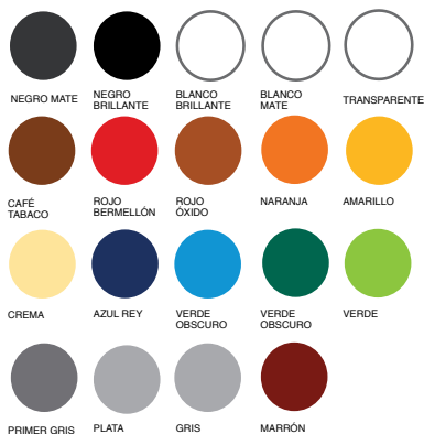
PINTURA EN AEROSOL