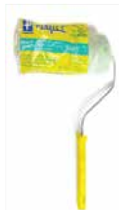
RODILLO PERFECT 4" 104