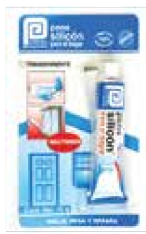
SILICÓN BLISTER UG