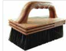
CEPILLO PERFECT #3204 ESTUCO