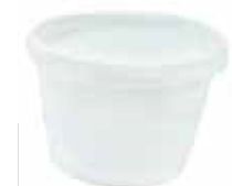
ENVASE DE PLÁSTICO