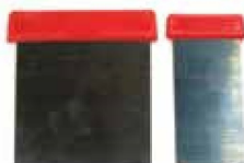
LAINA PARA RESANAR C/MANGO