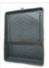
CHAROLA PLÁSTICO P/PINTURA