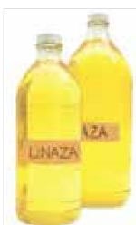
ACEITE DE LINAZA