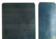
LAINA PARA RESANAR S/MANGO