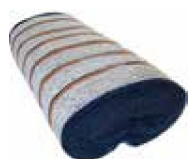
JERGA EN ROLLO