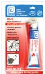
SILICÓN BLIS AUT ROJO