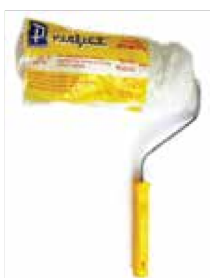
RODILLO PERFECT SUPER PACHÓN 149