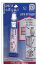
SILICÓN UG 20G.