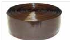
ZOCLO VINÍLICO CAFÉ