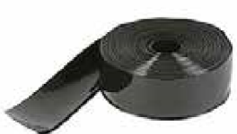
ZOCLO VINÍLICO NEGRO