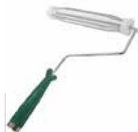
MANERAL P/RODILLO TIPO JAULA