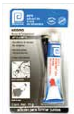
SILICÓN BLIS AUT NEGRO