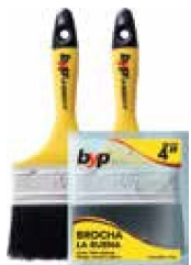
BROCHA BYP BUENA