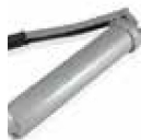
INYECTOR DE GRASA