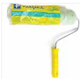
RODILLO PERFECT PACHÓN