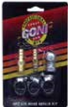
JGO 6 PZA.ACCE. P/ MANGUERA DE AIRE