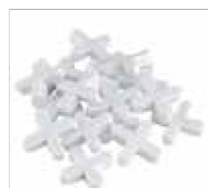
SEPARADOR DE PISO