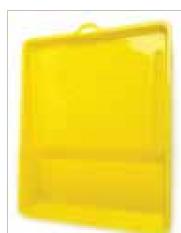
CHAROLA PLÁSTICO P/PINTURA