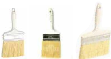
BROCHA ÉXITO CALZOMINA